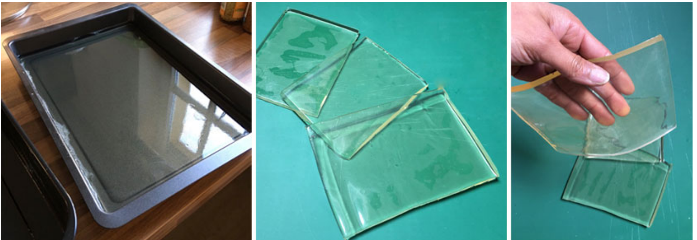
Die selbstgemachten Gelli Platten

In der ZAM-Druckwerkstatt suchen wir nach Möglichkeiten, diese wunderbare Technik für alle, Große und Kleine, zugänglich zu machen.