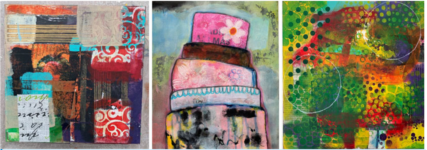
Gelli Print - Mixed Media