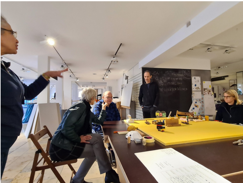
Oben: beim Erfinden der Personas