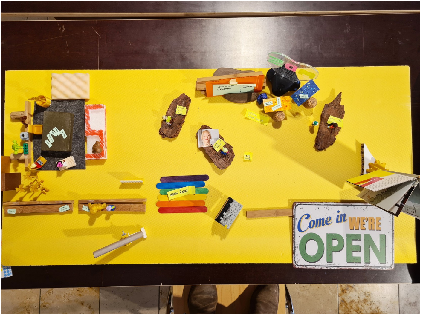
Oben: Modell "ANKOMMEN"

Wie sieht ein ZAM aus für diejenigen, die zum erstenmal vorbeikommen?