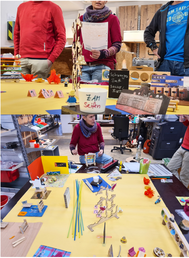
Oben: bei der Präsentation