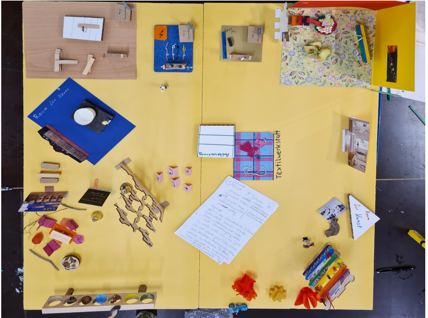
Oben: das Modell der Mach-Orte

Wie sieht ein ZAM aus für diejenigen, die hier Loslegen wollen und was Machen?