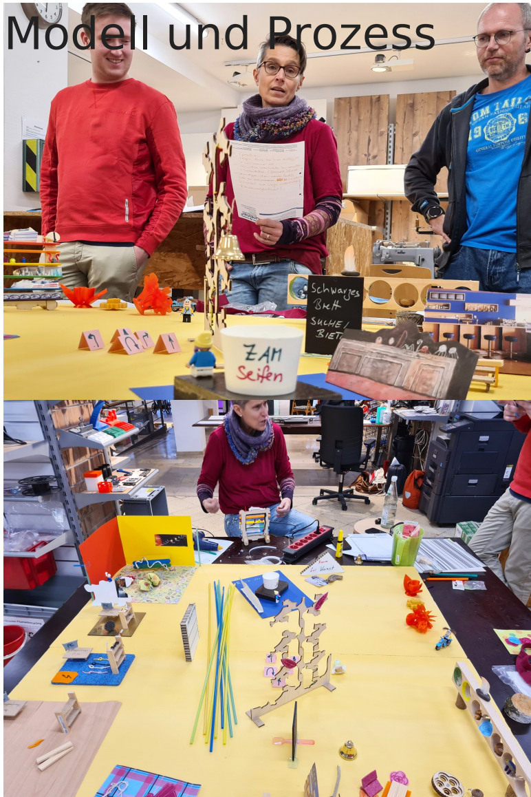
Oben: bei der Präsentation

Menschen zum Austauschen und überhaupt stärkende Kontakte.