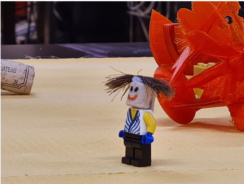
Oben: Details Austauschfläche; ein Werkstattleiter